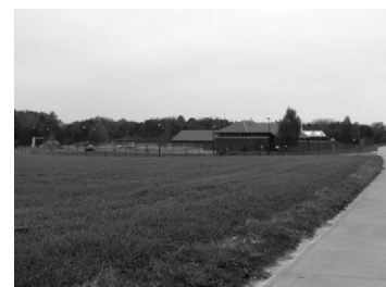
Station d'épuration des eaux usées domestiques