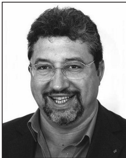
Le Bourgmestre, Mauro LENZINI

C'est dans cette nouvelle dynamique et dans l'espoir de voir ArcelorMittal continuer ses activités dans notre bassin sidérurgique qu'avec optimisme je vous présente, Mesdames, Messieurs, Chers concitoyens, mes meilleurs vœux de bonheur et de santé pour l'année 2008.