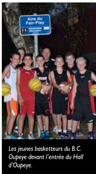
Les jeunes basketteurs du B.C. Oupeye devant l'entrée du Hall d'Oupeye.