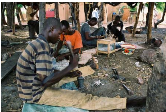
Photo : fabrication de bijoux artisanaux.

Un certain nombre de commerces proposent des produits de base le long de la grand route : alimentation générale, télé centre, carburant, ... Le commerce se pratique aussi sur le marché, trois jours par semaine. De nombreuses échoppes accueillent les vendeurs de tous genres : beignets, vêtements, cordes, quincaillerie, ... Mais il vient d'y avoir du changement. En effet, des échoppes « en dur » viennent d'être mises en location aux commerçants, ainsi qu'une halle aux viandes et un marché aux fruits et légumes. Ces nouvelles infrastructures remplacent l'organisation sommaire actuelle. Et le tout sera encore complété par d'autres nouveaux bâtiments. Le marché sera quotidien très prochainement. Et à terme, tout le marché sera réaménagé. Cela va participer au développement du commerce et générer de nouvelles recettes pour la ville.