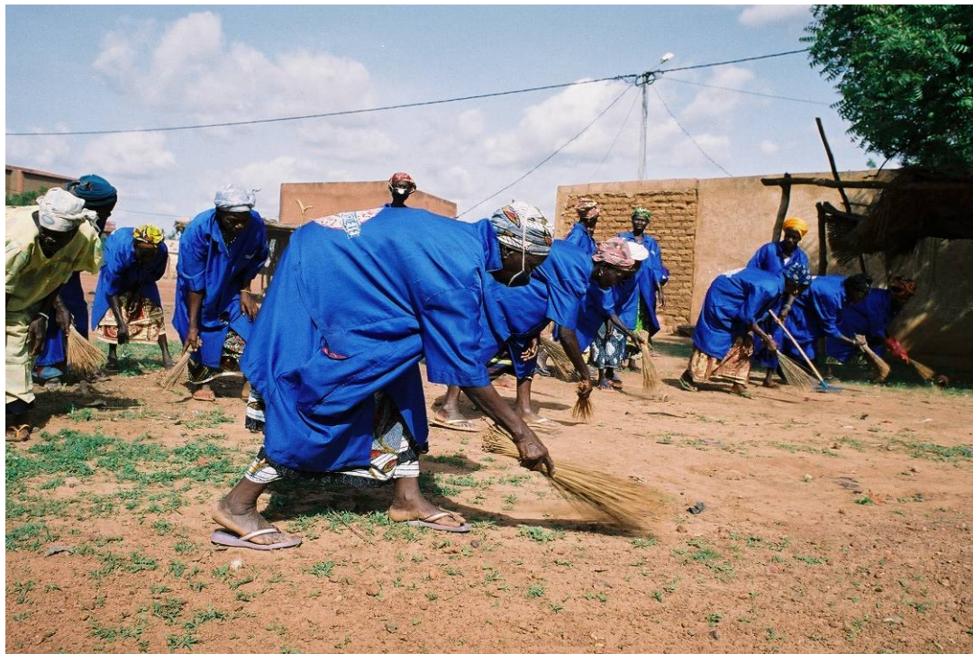
Photo : le projet s'inspire d'initiatives semblables dans d'autres villes. A Gourcy, des femmes interviennent déjà ponctuellement dans le secteur du centre, à titre bénévole.

travail effectif (deux jours/semaine), ce qui contribuera à la réduction de la pauvreté qui a surtout un visage féminin dans la commune. Chaque comité recevra du matériel de collecte et de nettoyage. Tout cela sera co-géré par le comité de secteur et la mairie. Chaque comité est responsable du bon entretien de son matériel sous le contrôle de la mairie. Un contrat sera élaboré à cet effet.