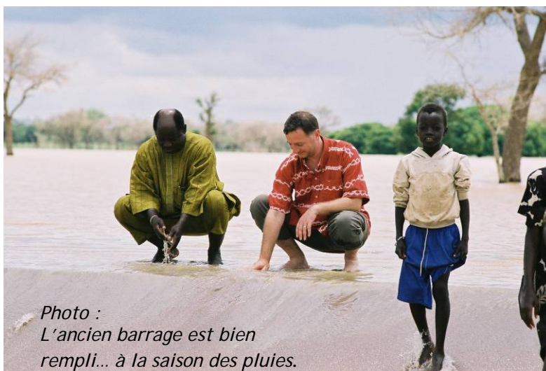
Photo : L'ancien barrage est bien rempli... à la saison des pluies.

Un important barrage est en construction et devrait être achevé cette année encore en amont de Gourcy. Un autre, plus ancien, existe mais est insuffisant. Le nouveau devrait retenir les eaux toute l'année ! Et permettre ainsi l'irrigation d'une part, l'alimentation de la nappe d'autre part. Il faut accumuler l'eau pendant la saison des pluies.