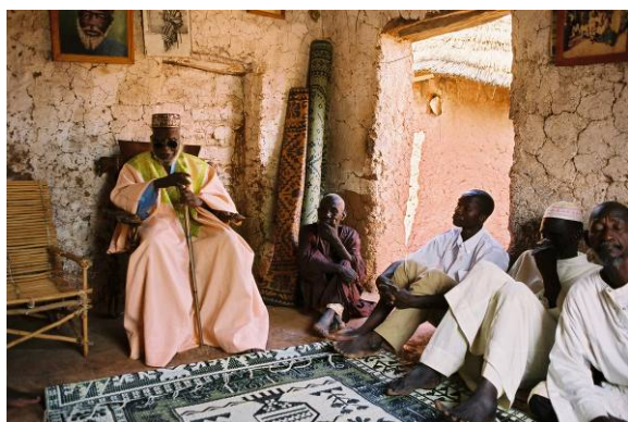
Photo : Visite de courtoisie au chef coutumier de Gourcy

moindre mesure, les protestants. Mais ces religions se mêlent aux croyances et traditions anciennes toujours bien vivaces.