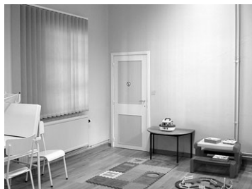
< Locaux ONE à Hermée