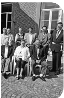
PERS-BROKA (50 ans de mariage)