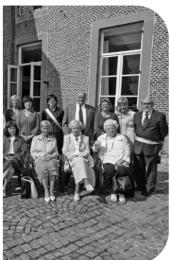
ET-THEUNENS (60 ans de mariage)