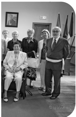
LENDERS de Vivegnis (mariage)