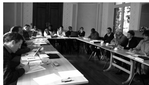
Groupe de travail avec les 9 communes belges partenaires d'une commune burkinabé.