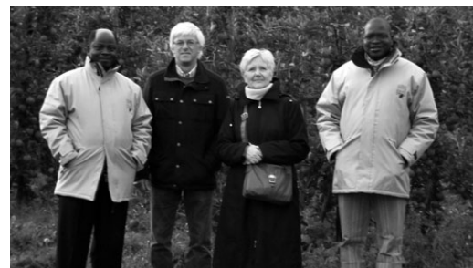
Opération « Sirop pour le Sud » : Nos hôtes ont découvert la fruiticulture locale accompagnés d'une représentation de la Commission Solidarité Oupeye.