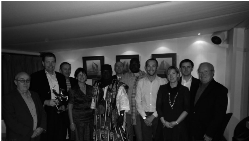
Rencontre avec les membres du Collège communal.

Quant au chargé de projet, il a suivi une formation au sein de différents services communaux : affaires humanitaires, finances, environnement.