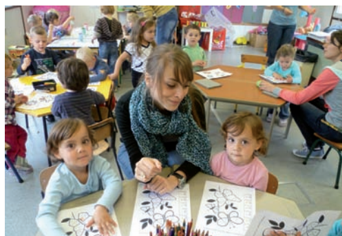
Le groupe des Poussins en pleine activité au Centre de Vacances

Nous remercions une nouvelle fois nos animatrices, nos animateurs ainsi que nos coordinatrices pour leur encadrement lors du Centre de vacances 2011