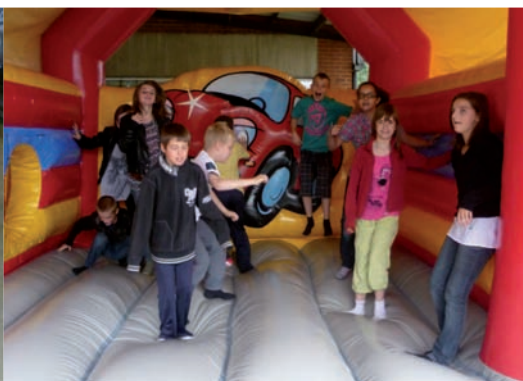
Nouveauté cette année, un château gonflable est installé tous les lundis pour le plus grand bonheur des enfants