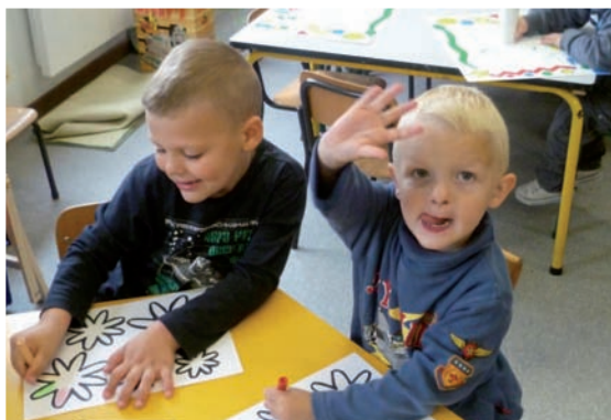
Centre de vacances d'Oupeye dans les locaux de l'école J. BODSON