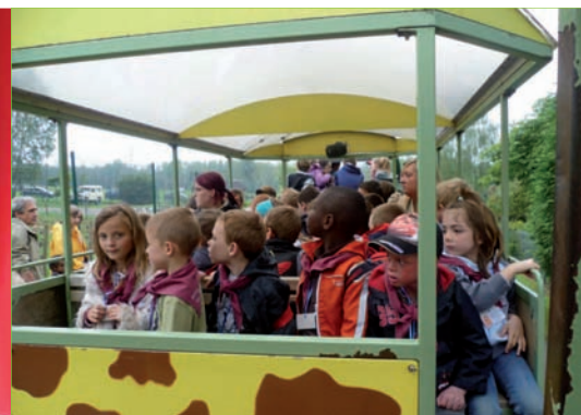
Visite du parc via un petit train au Monde Sauvage d'Aywaille