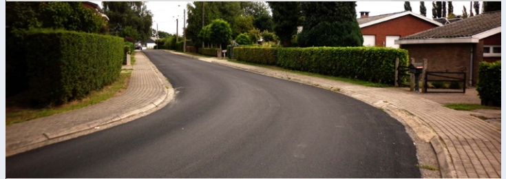
HERMEE : rue de la Trompette