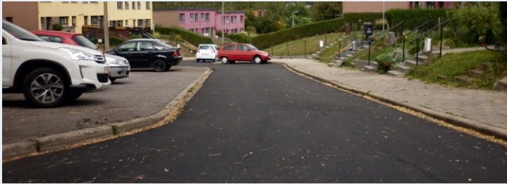
HEURE : rue des Héros