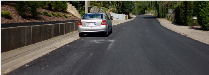
VIVEGNIS : rue Jean Volders