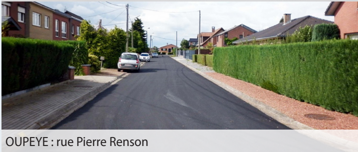
OUPEYE : rue Pierre Renson