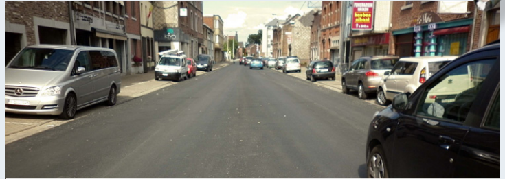
HERMALLE : rue du Perron