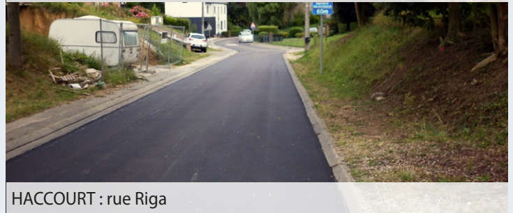
HACCOURT : rue Riga