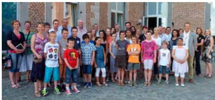
Les élus, leurs parents, les enseignants et directions ainsi que nos élus locaux ont partagé un verre de l'amitié à l'occasion de la clôture du CCE