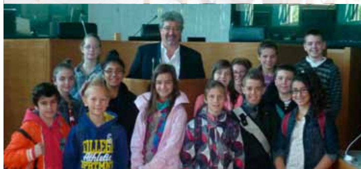
Le Conseil des enfants dans la salle des Séances plénières du Parlement Wallon avec le Député Bourgmestre Mauro LENZINI.