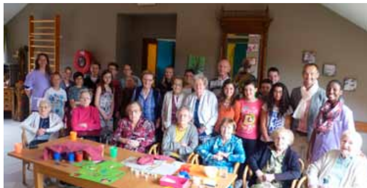
Les élus ont pu concrétiser leurs projets dans une maison de repos avec le soutien du personnel encadrant.

Quant à la visite annuelle du Parlement wallon, c'est avec grand intérêt que nos jeunes élus ont accompagné notre Député-Bourgmestre qui s'est prêté avec plaisir à ses fonctions de guide.